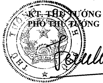
Lê Minh Khái